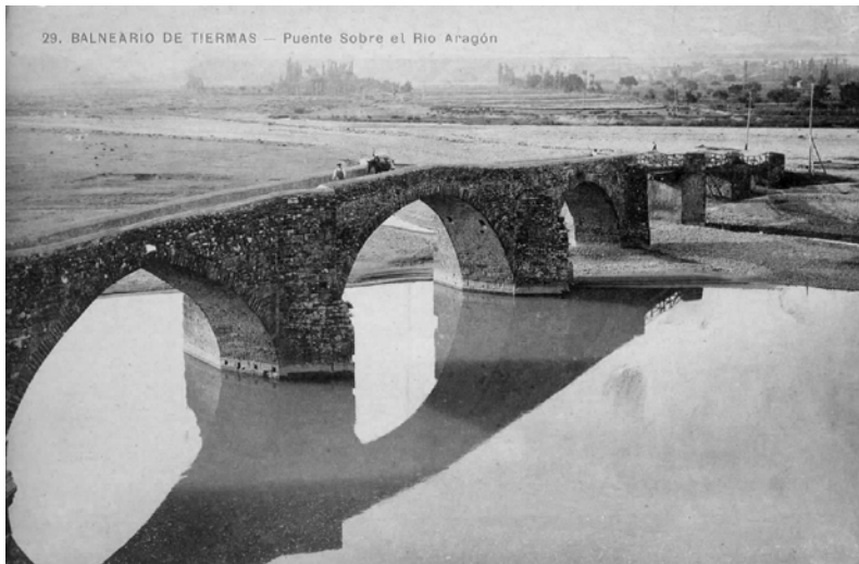
Tiermas. Puente de los Franceses. Restos bajo las aguas del embalse de Yesa.

Por otro lado, es necesario recapacitar si el impacto del sector inmobiliario y la necesaria expansión urbana, caso de la polémica del polígono del Llano de la Victoria en Jaca, es inevitable o si este tipo de ensanches pueden mejorarse, para evitar que tenga efectos negativos sobre el paisaje y el entorno natural y paisajístico del Pirineo, como así recomienda desde hace varias décadas la Carta de Venecia de 1964, teniendo en cuenta además que su valor singular es muy superior al de otros tramos del Camino de Santiago que discurren por la península Ibérica. Sin lugar a dudas, afecciones como la ejercida sobre los restos arqueológicos del Hospital de Santa Cristina de Somport debieran haberse evitado a toda costa. Ya que la pérdida del ambiente es una cuestión difícilmente reparable e incluso irreversible y la propia historia de la ciudad de Jaca nos puede servir como modelo, si recordamos que si su muralla no hubiera sido derribada en 1915, cuya presencia en su día incluso llegó a ser calificada de "sombra siniestra", hoy la ciudad presentaría un mayor valor patrimonial. De la misma manera que si no se hubiera demolido el templete de Santa Orosia, construido en 1908 en el antiguo Campo del Toro, en la actualidad sería considerado una singular construcción eclecticista.