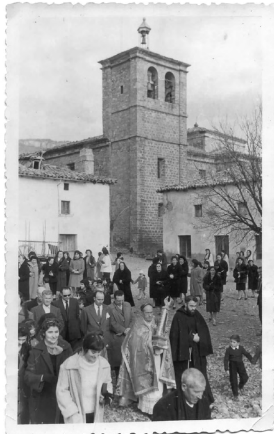
Tiermas. Procesión de San Virila.

Sin adoptar posturas tan extremas como John Ruskin (1819-1900) que, a mediados del siglo XIX, rechazaba la restauración por considerar que falsificaba los monumentos, pues obviamente necesitamos intervenir en el patrimonio para favorecer su conservación, citamos textualmente algunas frases de su obra, Las siete lámparas de la arquitectura (1849), cuando se refiere a nuestra misión en la historia: "la conservación de los monumentos del pasado no es una simple cuestión de conveniencia o de sentimiento", ya que para este crítico de arte inglés "no nos pertenecen" porque "pertenecen en parte a los que los construyeron y en parte a las generaciones que han de venir detrás". Unas palabras que hubieran debido servir de guía para evitar las duras polémicas e incluso fuertes enfrentamientos que han llegado a producirse en ocasiones, como la surgida con motivo del traslado del retablo mayor de la catedral de Santo Domingo de la Calzada, obra del escultor Damián Forment, donde los miembros integrantes en ese momento de la Comisión del Patrimonio Histórico-Artístico de la Rioja actuaron al margen de la normativa española y de los criterios internacionales, al trasladar esta obra maestra de la escultura renacentista desde el altar mayor, para el cual había sido concebida y lugar donde llevaba siglos ubicada, a uno de los brazos del crucero. De hecho, este cambio de emplazamiento ha distor-