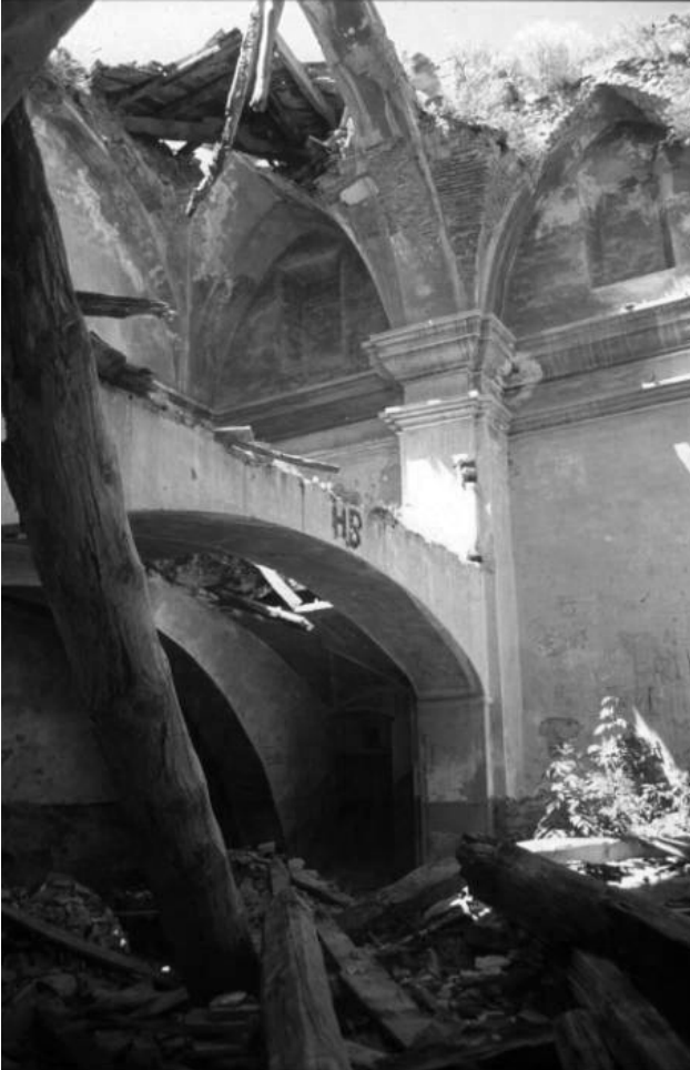
Tiermas. Iglesia parroquial de San Miguel. Estado ruinoso.